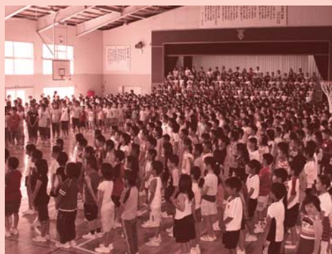
7月9日(月) 日新小学校 全校合唱 (1009人合唱)