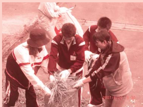
6月24日(日) 城南中学校 親子早朝奉仕作業