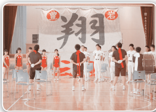
応援団によるエール

雄物川の向こうに高くそびえる太平山、学校の周りには山や田んぼに囲まれ緑がいっぱい。 また、季節によっては、枝豆の作付けが畑を覆い、夕方から夜にかけて、たぬきが道路を横断、日中は、カモシカがじつとこちらを観察する姿、夜には螢の乱舞、たまに熊情報が入る。そして、卒業式の時期になると、白鳥の群れが田んぼを覆い、北に帰る準備をしている。 そんな自然に恵まれた地域に学舎はある。 さて、PTA会長活動をはじめ二日目、各種PTA行事には、時間の許す限り、参加しようという心がけている。 最近では、学校行事で行くと一部の子どもたちが、笑顔で、手を振って迎えてくれる。そんな時、会長として、子どもたちとの距離が縮まったような気がして、嬉しい限りである。 今年度も、中総体の学校激励会に参加した。 各部の状況は、少子化の影響で人数が少ない。 しかし、そんな状況も一人一人の自覚と努力で日々、練習に取り組み、大会へ参加したことは、誇りに思い敬意を表するところである。 激励会では、何人かの保護者が参列し、応援する姿があった。激励される方、する方と本当に規模なものではあるが、心のこもった激励会であった。そんな中、恥ずかしながら会長として、飛び入りで応援のエールを贈った。 子どもたちにどう映ったのだろうか？ 体育館を後にするとき、「ありがとございました！」の大きな声が私の耳に響く。 子どもたちは確実に成長していることを実感した瞬間である。