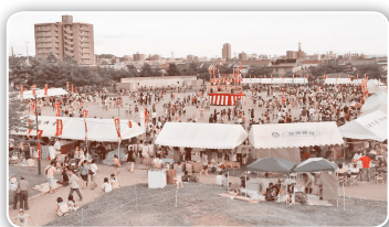
やぐらを中心に、町内会の出店が並ぶまつり会場（泉中央公園）

難しい話はさておき、「泉の夏まつり」にまだお越しでない方は、是非一度足をお運びください。そして、若干でもこの話しを思い浮かべて頂けたなら幸いです。