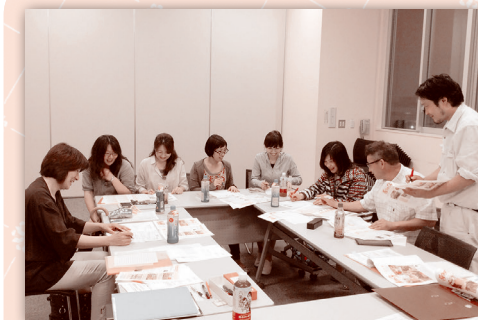
編集会議の様子 西部市民サービスセンターにて