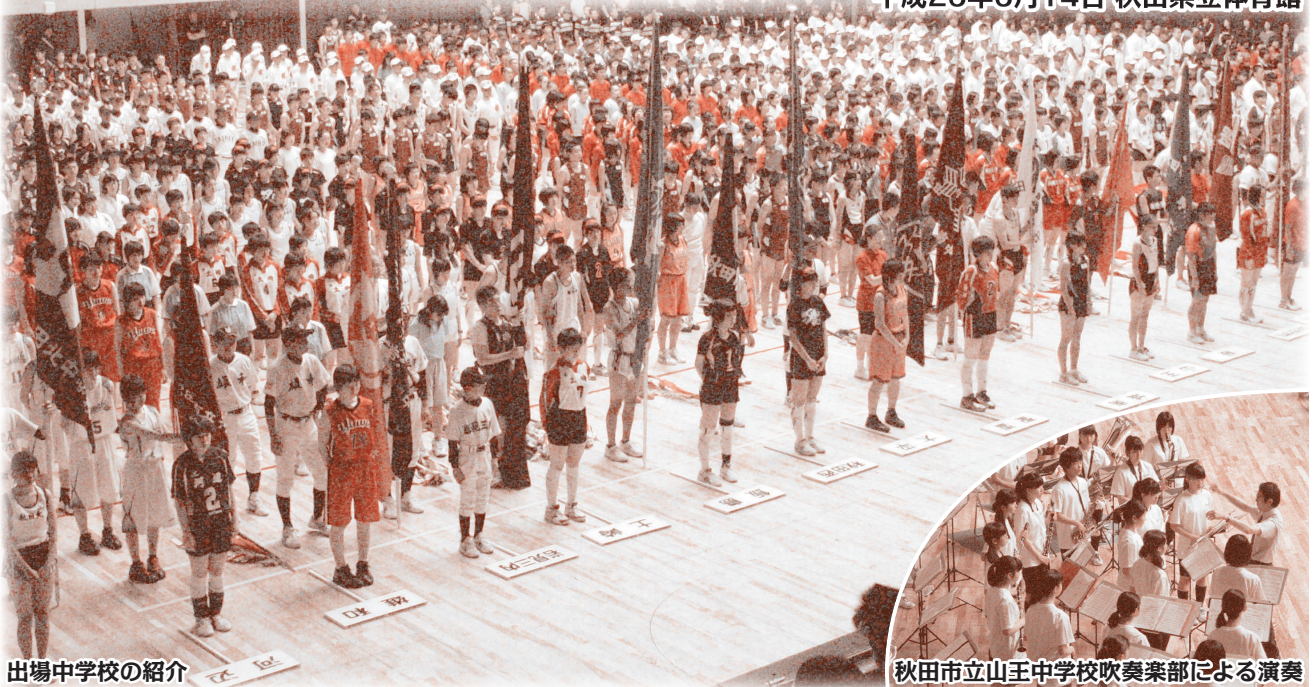
出場中学校の紹介