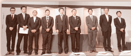
平成26年度 役員紹介

本年度も東日本大震災被災地への支援を続けてまいりますと共に、秋田の子どもたちが輝き、可能性を広げる事のできる環境をつくり、また我々大人も子どもと一緒に成長できるような活動を積極的に行っていくことを目標に掲げ、盛大な拍手の中、閉会いたしました。盛会であったことを報告いたします。