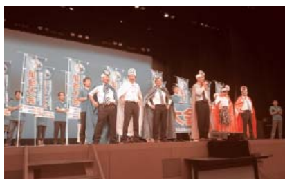
弘前大会において東北各県の会長とH30年8月開催「仙台大会」のPR活動

すべては「愛してやまない子どもたちのため」に「これからも邁進してまいりたい」と思いますが、今後ともみなさまのご理解とご協力をよろしくお願いします。