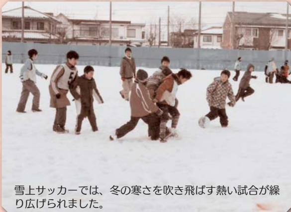
雪上サッカーでは、冬の寒さを吹き飛ばす熱い試合が繰り広げられました。