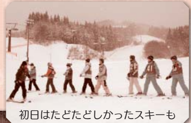
初日はたどたどしかったスキーも