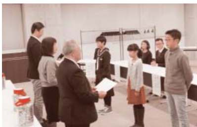
一円玉福祉募金贈呈式