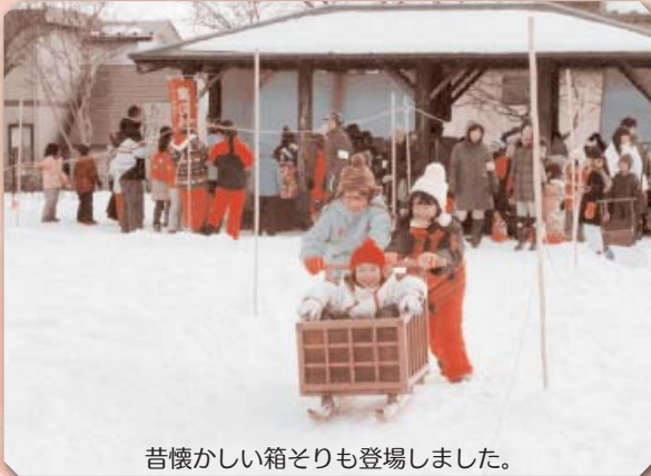
昔懐かしい箱そりも登場しました。