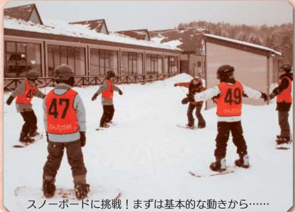
スノーボードに挑戦！まずは基本的な動きから……