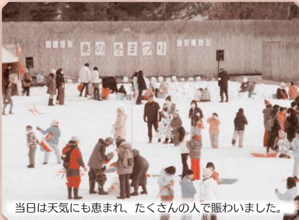
当日は天気にも恵まれ、たくさんの人で賑わいました。

子どもも大人も、たこあげやそりあそびなど、冬ならではの雪遊びを元気いっぱい楽しみました。