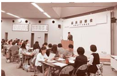
会報の作り方研修会

最後に「あきたっ子」発行にあたり、お忙しい中ご寄稿下さった皆様、編集作業にご協力いただいた方々に感謝を申し上げます。ありがとうございました。