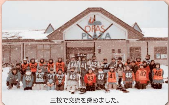
三校で交流を深めました。

1月31日～2月1日に1年生の宿泊体験学習を太平中学校、豊岩中学校、下浜中学校の三校合同で行いました。小規模校同士がスポーツを通して交流し、有意義な宿泊体験学習となりました。