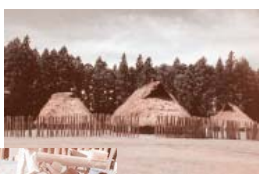
地蔵田遺跡「弥生っ子村」

今年度の文化研修部活動にご協力いただいた皆様に感謝申し上げます、ご報告させていただきます。