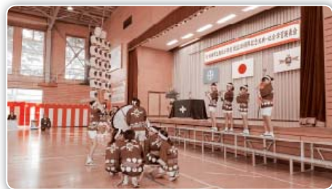
記念式典での竿燈の妙技