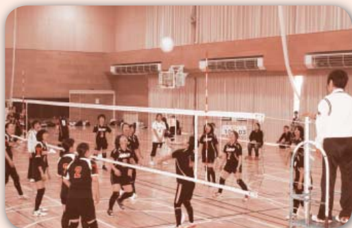
バレーに汗を流すお母さんたち

毎年恒例となっている山王地区五校対抗球技大会が、十月一日(日)旭南小学校で行われました。今年では当番校の旭南小が八年ぶりに軟式野球にチームを出し、約十年ぶりに軟式野球・ビニールバレーの二種目で、山王中、保戸野小、川尻小、旭北小、旭南小の五校がそれぞれチームを出し試合をすることができました。当日は天候にも恵まれ、各校の選手が野球にバレーに熱い戦いを繰り広げました。 試合結果は、軟式野球の部、優勝川尻小、準優勝旭南小、ビニールバレーの部、優勝川尻小、準優勝山王中と川尻小がアベック優勝をしましたが、野球、バレーとも各所にハッスルプレーが見られ、各校の応援にも熱が入りました。大会終了後、秋田パークホテルにて五校の関係者が参加して懇親会を行い、お互いの親睦を深めました。 競技に参加していただいた各校の選手の皆様、当番校として運営にご協力いただいた旭南小の保健体育部並びにPTA役員の皆様、ご協力誠にありがとうございました。