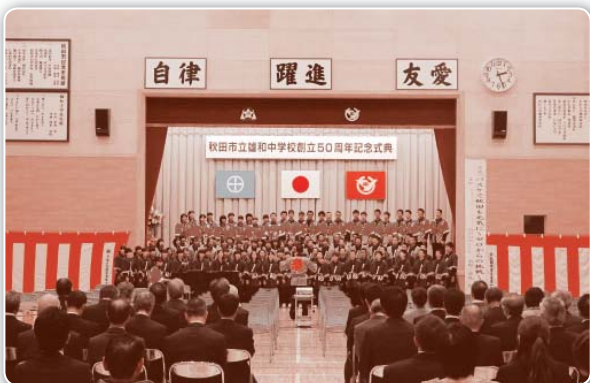
スクールソング「YELL」の合唱

今後も、雄和中学校が雄和の子どもたちにとってかけがえのない大切な場所であり続けるために、引き続き地域の皆様方のご支援ご協力を願います。