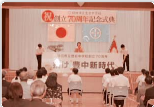
「描け 豊中新時代」スローガン発表