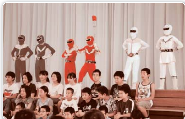
外小マンも新ユニフォームに変身