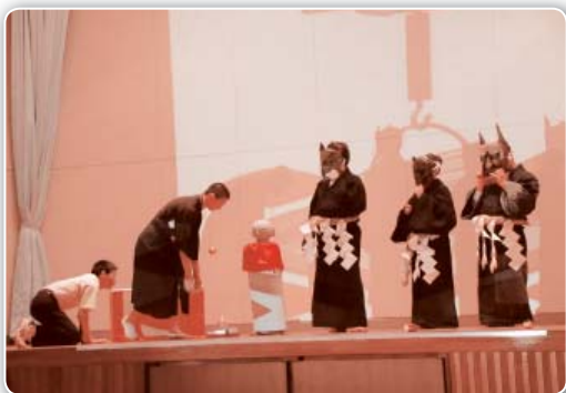
やまはげも登場した創作劇

また、創立七十周年にあたって、生徒たちは「描け 豊中新時代」というスローガンを掲げました。この言葉どおり、これからの新しい時代を生徒一人一人が自らの想像力で描き、新たな豊岩中学校の歴史を築き上げて欲しいと感じた記念式典でした。