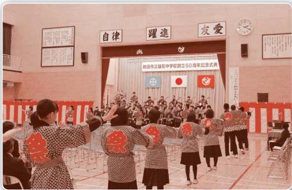
全校生徒による「大正寺おけさ踊り」