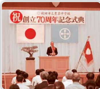
70周年記念式典の様子