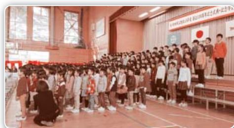
全校生徒による創立130周年記念メッセージ

外旭川小学校は明治十年に神田小学校として開校し、昭和二十九年に秋田市に合併され現在の「秋田市立外旭川小学校」となり、明治、大正、昭和、平成と長きにわたり歴史を刻んでまいりました。地域の方々、歴代のPTA役員、そしてこれまで子どもたちのためにご尽力くださった先生方がいたからこそ、この百四十年という長い歴史を作ってくられたものと思っております。 七月十五日には創立百四十年記念式典、学習発表会が行われました。発表会ではこの日のために沢山の練習をしてきた子どもたちの元気な声が響きわたり私自身外旭川小学校のOBとしても頼もしく感じました。 学校の授業での町探検や郷土探訪学習を通じて地域との関わりを強くし、外旭川小学校が今後百五十年、百六十年と歴史を重ねていけるよう、これからの未来を担う子どもたちをPTA活動を通じて支えていきたいと思っております。