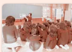
各クラスで読みます