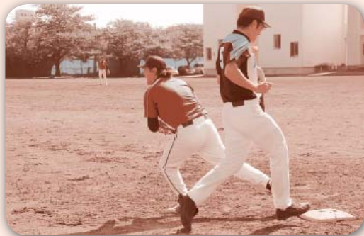
野球で頑張るお父さんたち