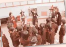
イベントin長休み お話の中で、歌も披露!