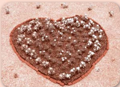
光庭のハート花壇