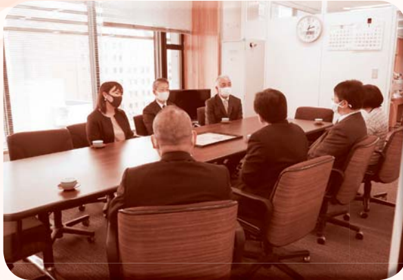
受賞報告会（秋田市教育委員会）