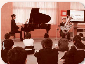
スクールコンサート

本校は令和五年に閉校となりますが、残り二年、豊岩中学校らしい温かいPTA活動をしていきたいと思っております。