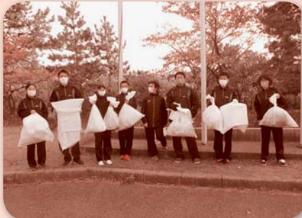
通学路のゴミ拾い

本年の協賛金は、生徒たちの願いであった校内中庭の再生にも充てさせていただきました。多くの方々のご協力のもと、荒れていた中庭は生徒たちの手で美しい花のあふれる庭に再生しました。生徒たちも充実感と達成感で満ちあふれています。今後も整備を続け、いつか地域の皆様にお披露目できる機会を楽しみにしています。