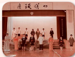
全校演劇（令和2年度豊中祭）