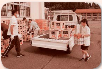
夏休み中の空き瓶回収