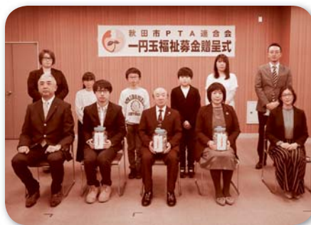
一円玉福祉募金贈呈式