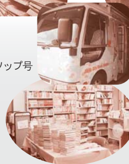
イソップ号の準備をするお部屋