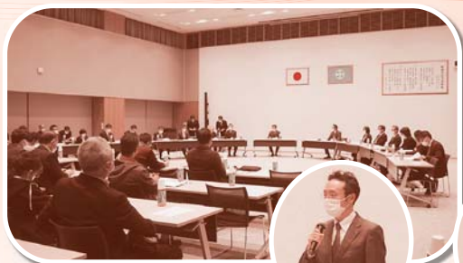
秋田市教育委員会にて