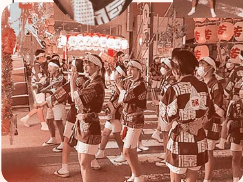
夏の間 磨いた技を披露