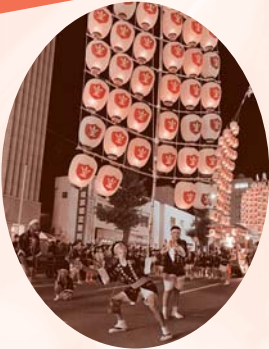
3年ぶりの演技披露に張り切る差し手