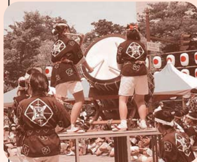
3年ぶりの妙技会・お囃子