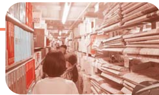
たくさんの新聞が保管されています