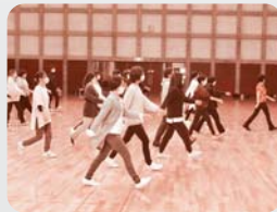
視線はまっすぐ颯爽と