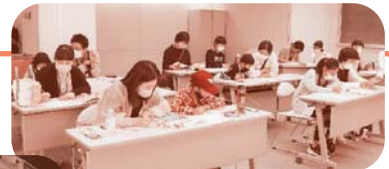
おすすめの本のポップ作り