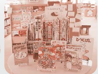
展示コーナー「いただきます」完成