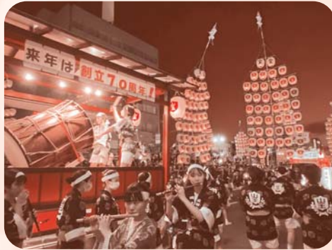
太鼓、横笛で連携しおまつりを盛り上げる囃子方