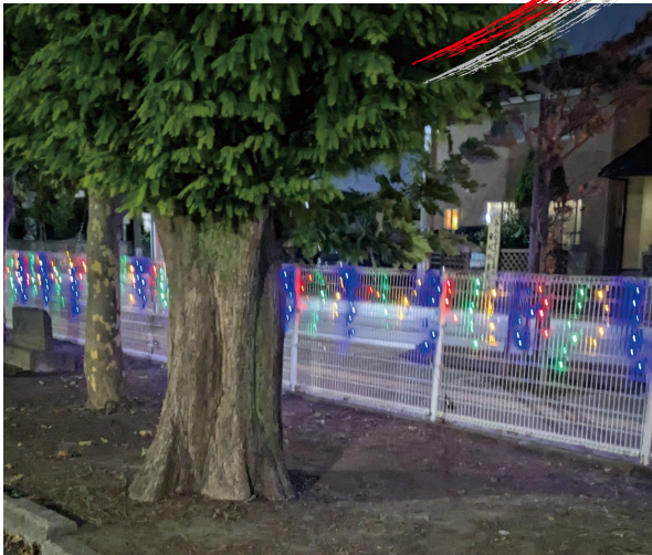
エコなソーラーイルミネーション

子どもたちが新世紀の担い手として成長してくれることを願い、「あきたっ子」としました。